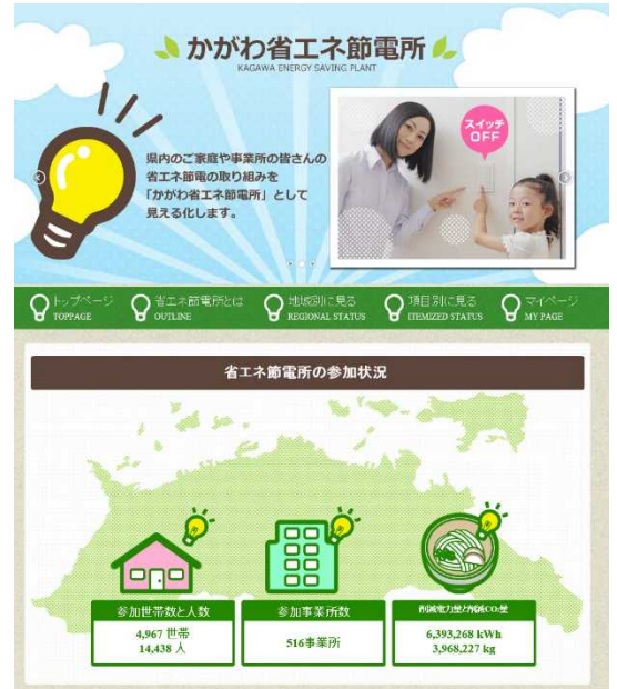
かがわ省エネ節電所 トップページ

ご家庭や事業所で取り組んでいる省エネ節電行動にチェックすることで、電力やCO 2 の削減量が一目で分かるサイトです。