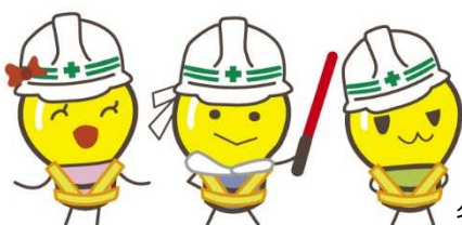
省エネサポート隊