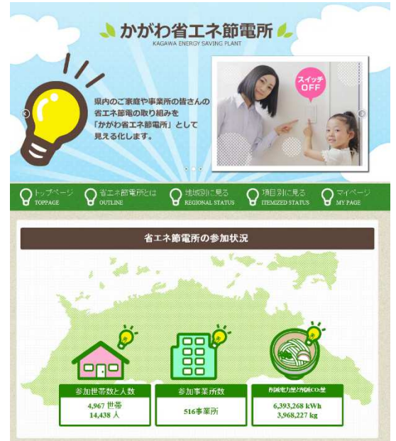
かがわ省エネ節電所 トップページ

ご家庭や事業所で取り組んでいる省エネ節電行動にチェックすることで、電力やCO 2 の削減量が一目で分かるサイトです。