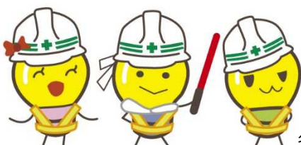
省エネサポート隊